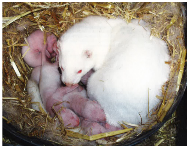
Kiinteitä, hyvin kehittyneitä pentuja. Kuva: Dansk Pelsdyravl 4/12 s. 54

© Tapio Hernesniemi turkistuosannon lehtori Keski-Pohjanmaan aikuiskoulutus Ajantasalla-hanke tapio.hernesniemi@kpedu.fi